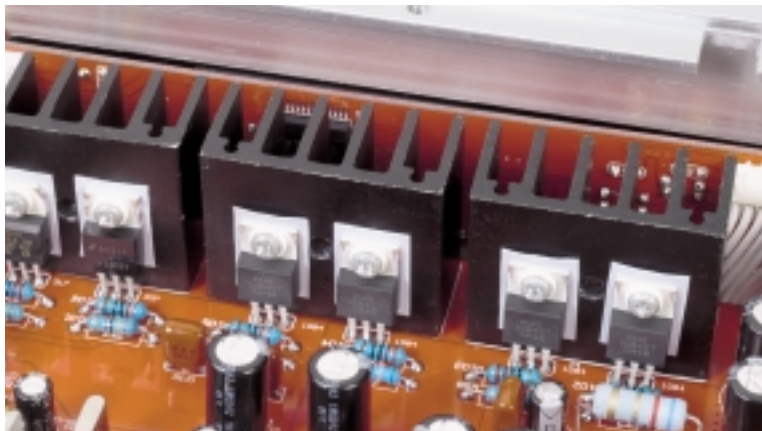
In der Vorverstärkung setzt Ayon vier russische Röhren ein (rechts), die dem vollsymmetrischen CD-1 seinen unverwechselbar flüssigen und warmen Charakter verleihen. Eine Bank von MOS-FETs (links) kontrolliert indes die Spannung der gematchten Trioden