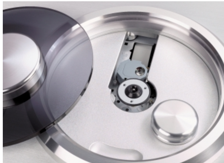
Der Top-Loader verbirgt sein Laufwerk hinter einer dunklen Abdeckung. Im Betrieb werden die Medien von einem magnetischen Puck fixiert

Ayon wollte mit dem neuen Gerät nicht einfach seine Produktlinie vervollständigen. Ziel der Entwicklung war es